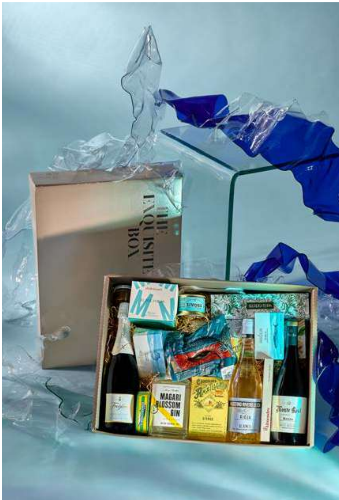
LOTE THE EXQUISITE BOX 309 REF. 4D2CTEB309 - 80,27€ 91,18€ IVA INC.