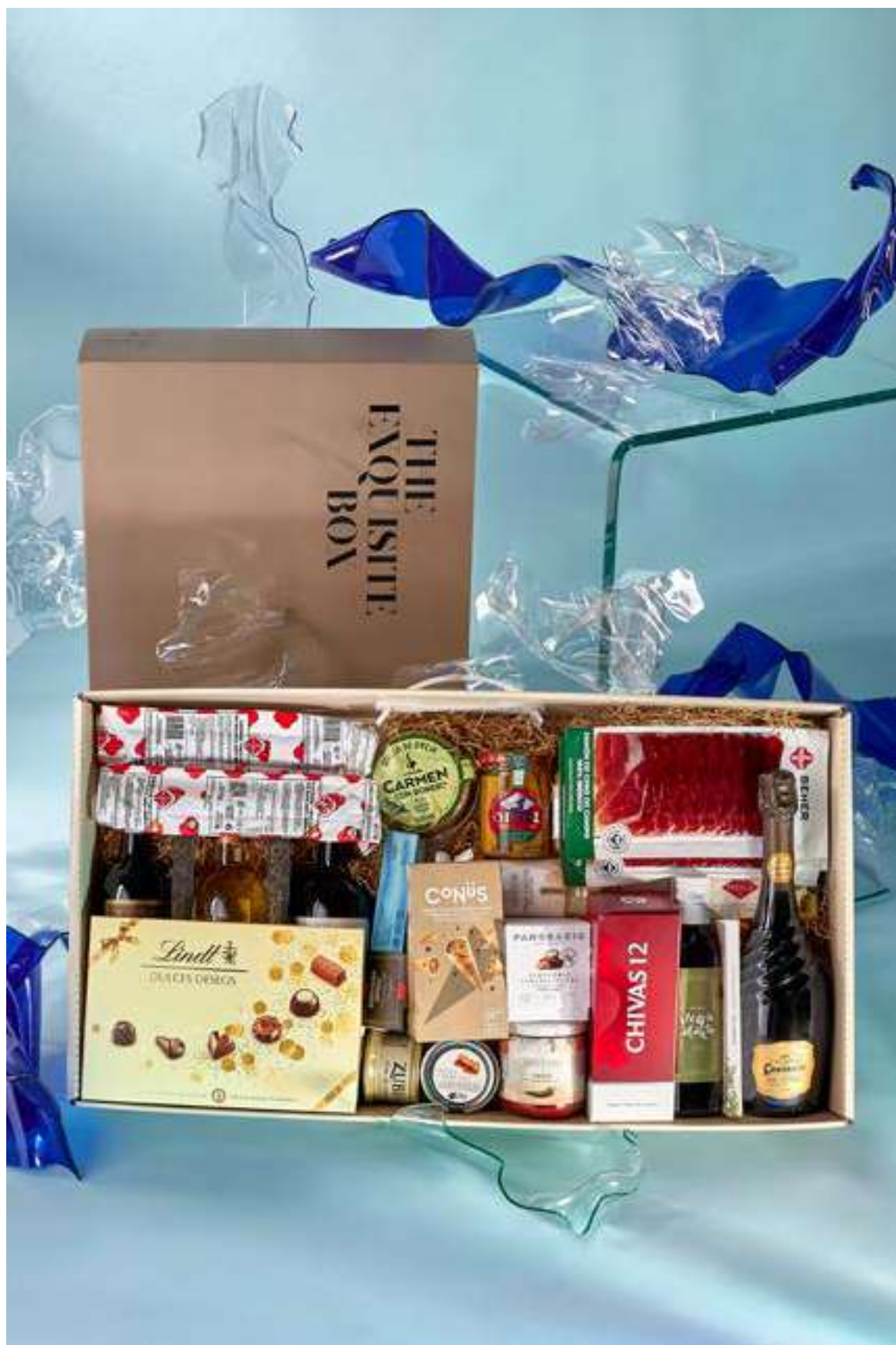
LOTE THE EXQUISITE BOX 305 REF. 4D2CTEB305 - 174,20€ 195,76€ IVA INC.