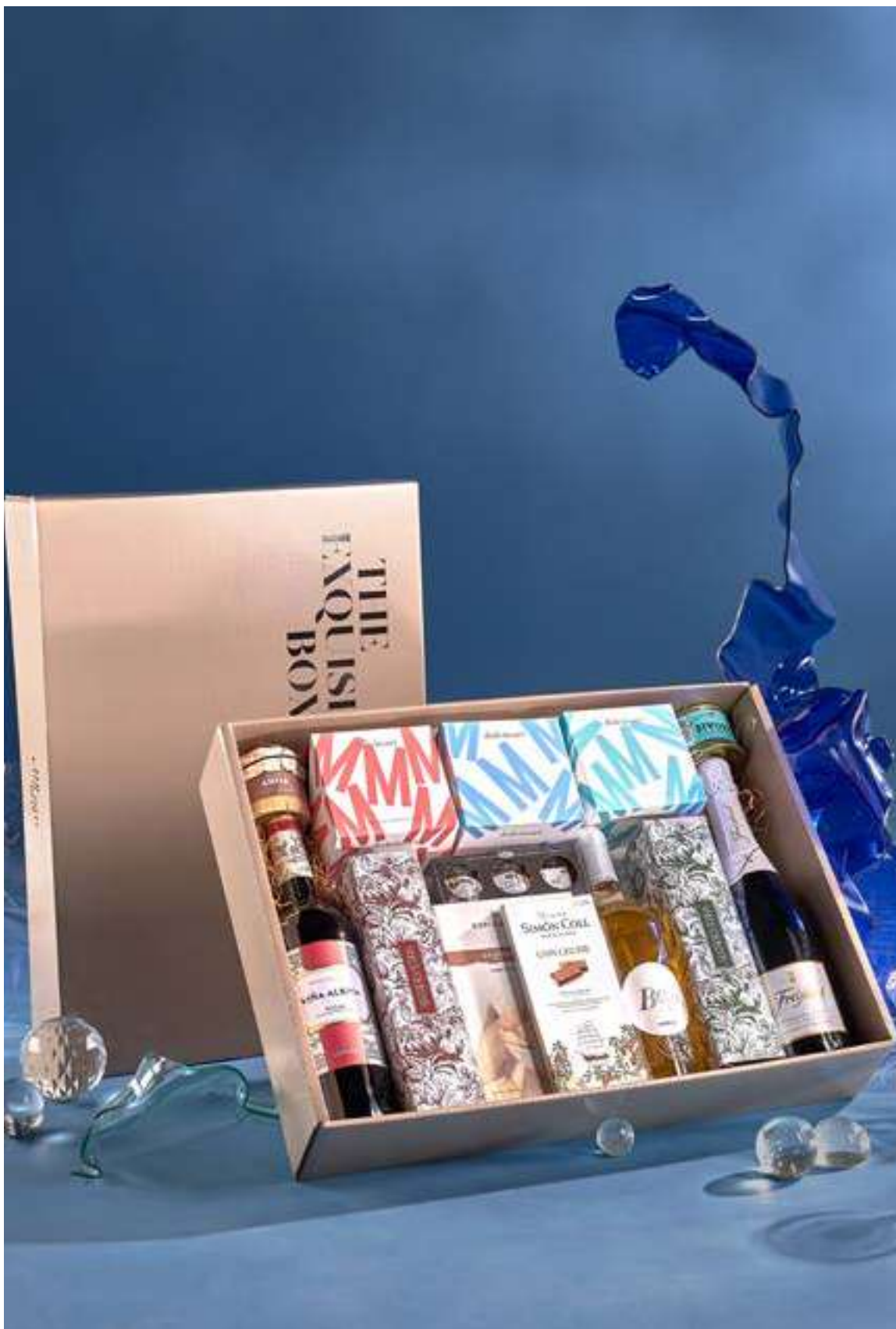
LOTE THE EXQUISITE BOX 320 REF. 4D2CTEB320 · 46,92€ 53,33€ IVA INC.