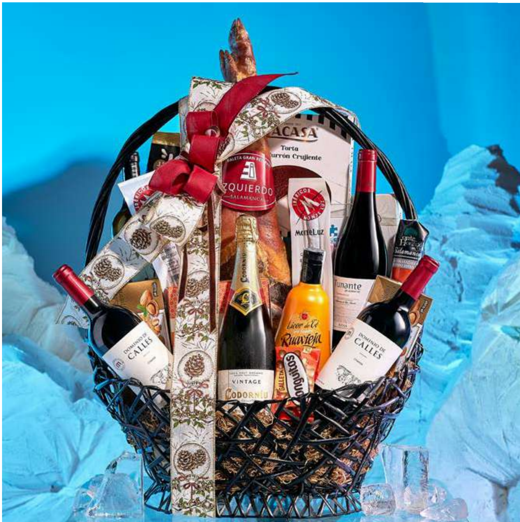
La cesta 502 se presenta decorada con cintas y envuelta en tul.