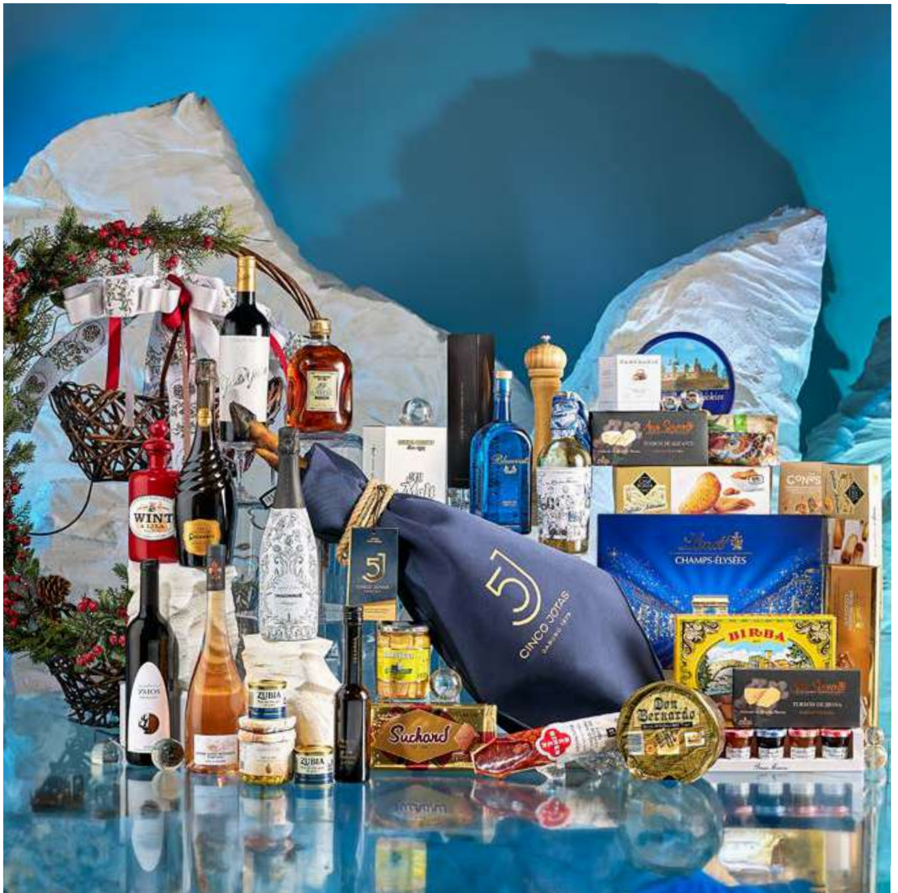
La cesta 510 se presenta decorada con cintas y envuelta en tul.