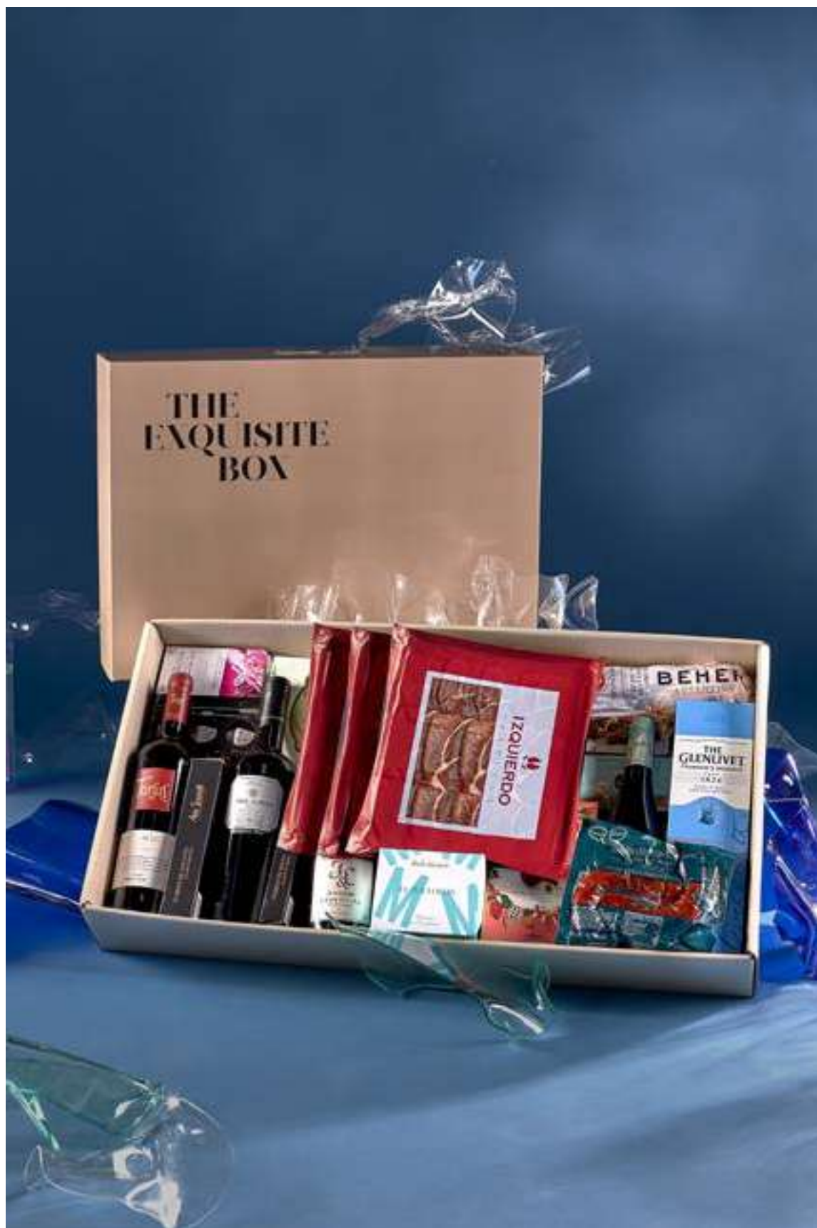
LOTE THE EXQUISITE BOX 304 REF. 4D2CTEB304 - 199,36€ 225,68€ IVA INC.