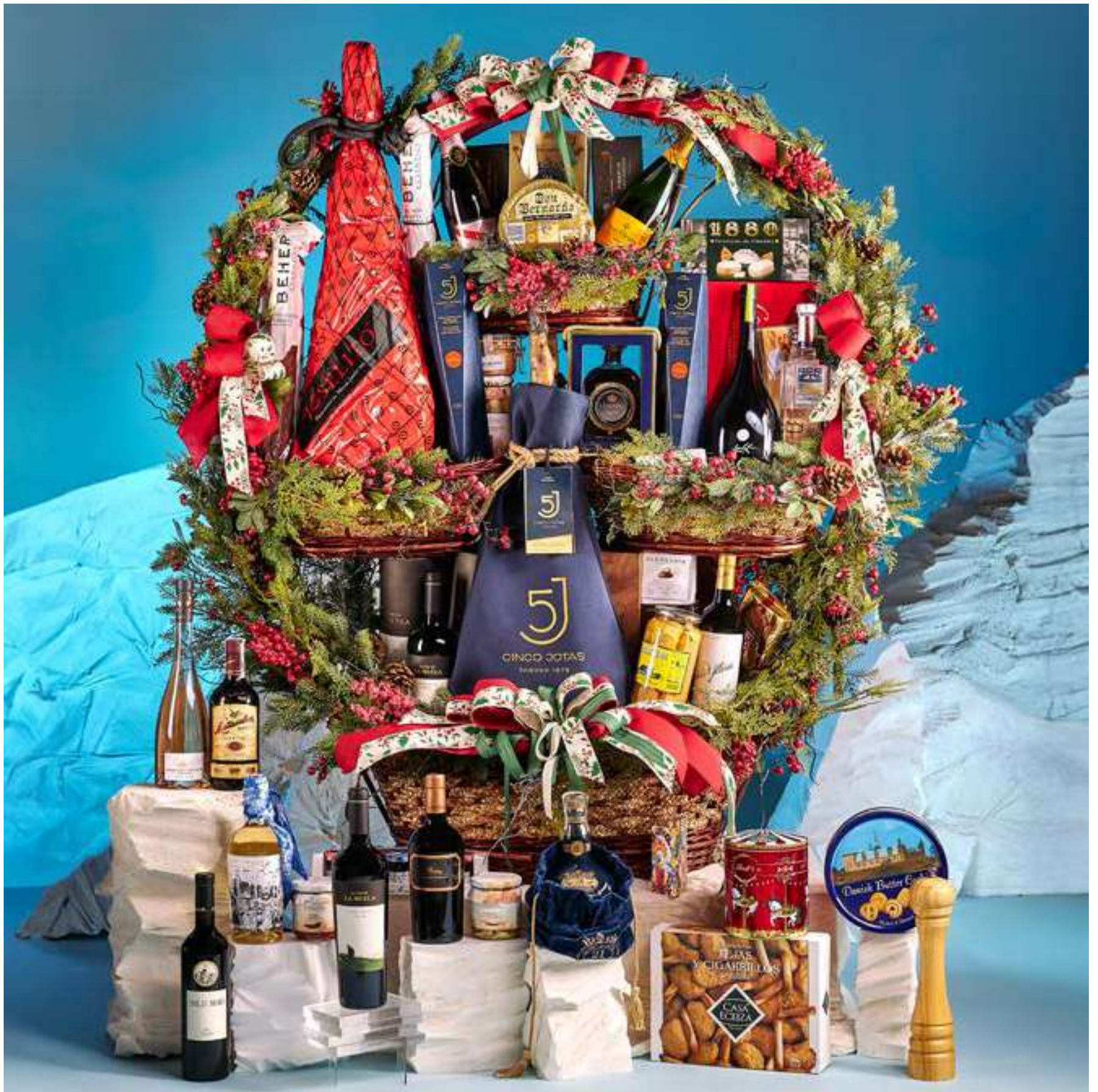
La cesta 512 se presenta decorada con cintas y envuelta en tul.